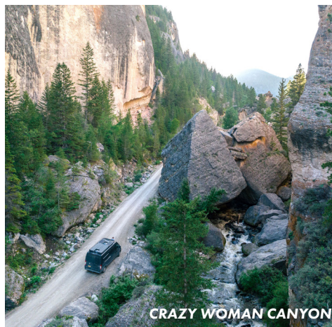
CRAZY WOMAN CANYON

Il Crazy Woman Canyon presenta una tortuosa strada sterrata che attraversa imponenti pendii rocciosi e grandi massi con un ruscello impetuoso che sembra una cascata infinita. La strada si unisce alla Highway 16 nelle Bighorn Mountains per altre opportunità di svago sulla via del ritorno a Buffalo. Oltre alle numerose strade di accesso ai sentieri, altre tappe sulla Highway 16 sono Tie Hack Reservoir , Mosier Gulch Picnic Area o qualsiasi punto del Clear Creek Trail System .